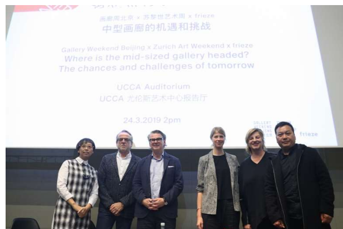
画廊周北京 VIP 论坛“中型画廊的机遇和挑战”，与苏黎世艺术周和 frieze 杂志合作