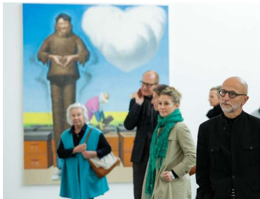
苏黎世藏家团到访画廊周北京参展机构