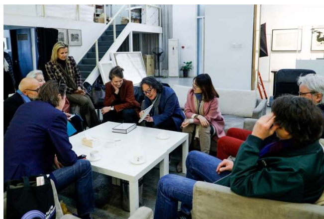
苏黎世藏家团参观艺术家徐冰工作室