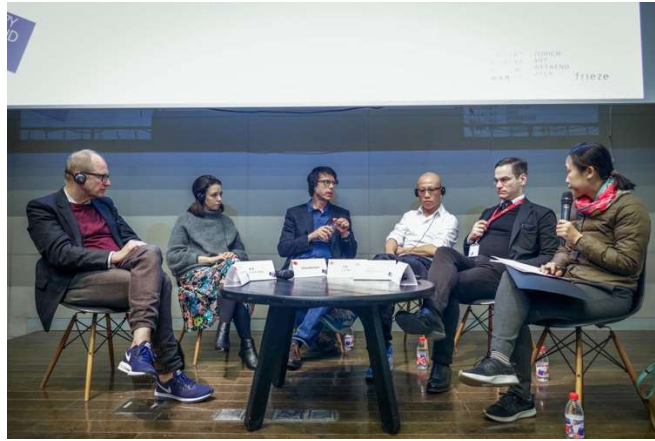
画廊周北京VIP论坛“公共艺术的形式、意义和目的”，与苏黎世艺术周和frieze杂志合作

“我支持北京和苏黎世的这两个年轻艺术平台之间的多方面合作。在北京和苏黎世成为当代艺术的世界级中心的愿景里，持续的文化交流是至关重要的。”知名艺术赞助人乌里·希克作为北京与苏黎世艺术交流大使，支持并认同两个城市之间艺术访问活动的影响力和重要性。在他看来，北京和苏黎世都是在经济、政治、文化领域举足轻重的城市，与此同时，老牌艺术博览会在本国举办吸引了众多藏家、媒体前来参观。而画廊周北京与苏黎世艺术周在组织经营上亦拥有许多相似性：不局限于画廊商业活动，各机构联合起来推广自身，注重艺术欣赏的整体体验与学术策展的能量，多区域相互联动、扶持，形成整个城市的文化事件，美术馆和博物馆的加入更强调了面对公众的艺术培育作用。画廊周北京与苏黎世艺术周的合作创设了相互交流经验的机会。